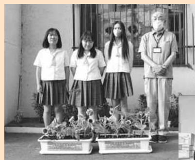
巨理高校 ひまわりプロジェクト様