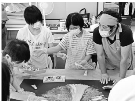
ほのぼの園での活動