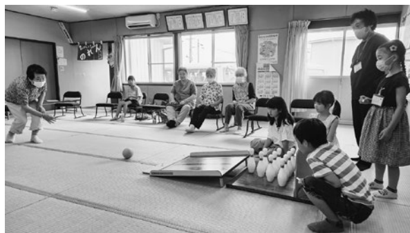
地域のサロンでの活動