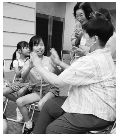
さざんかの会での活動

内容や日程に応じて申し込みいただき、延べ41名の子ども達が参加しました。体験や交流などを通して様々なことを感じとってもらえたようでした。